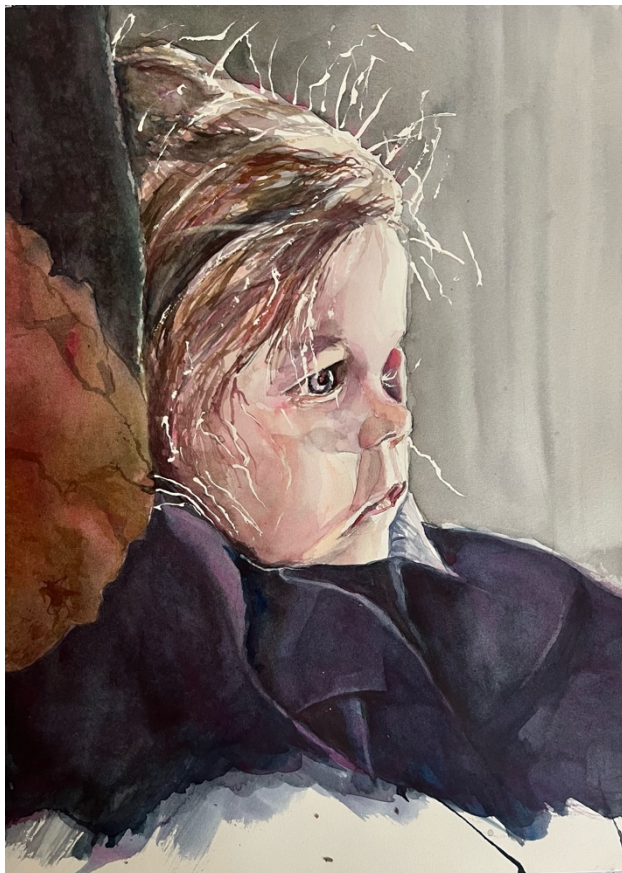
Porträtt av Ava - Beatrice Janssons målning.